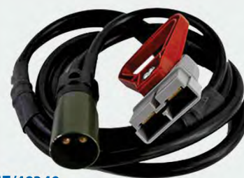
▶ BAT/48349 Câble NATO