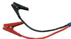
Câbles et pinces de démarrage