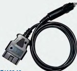
▶ BAT/48348 Câble mémoire OBD2 BOOSTER DE DÉMARRAGE